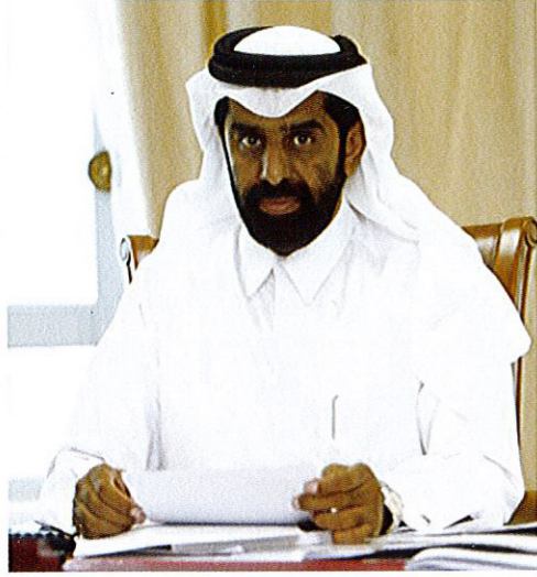
سعادة الدكتور/صالح النائب الأمين العام للأمانة العامة للتخطيط التنموي

تمر قطر في هذه السنة بالذكرى الأربعين لاستقلالها. ما هي برأيك أهم إنجازات قطر، على المستوى التنموي، خلال العقود الأربعة المنصرمة؟