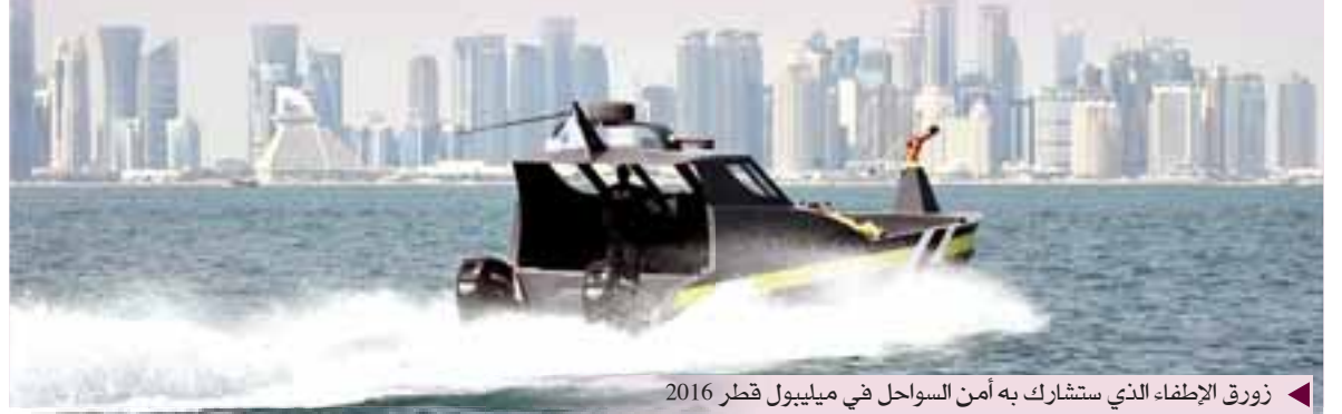
زورق الإطفاء الذي سشارك به أمن السواحل في ميلبول قطر 2016