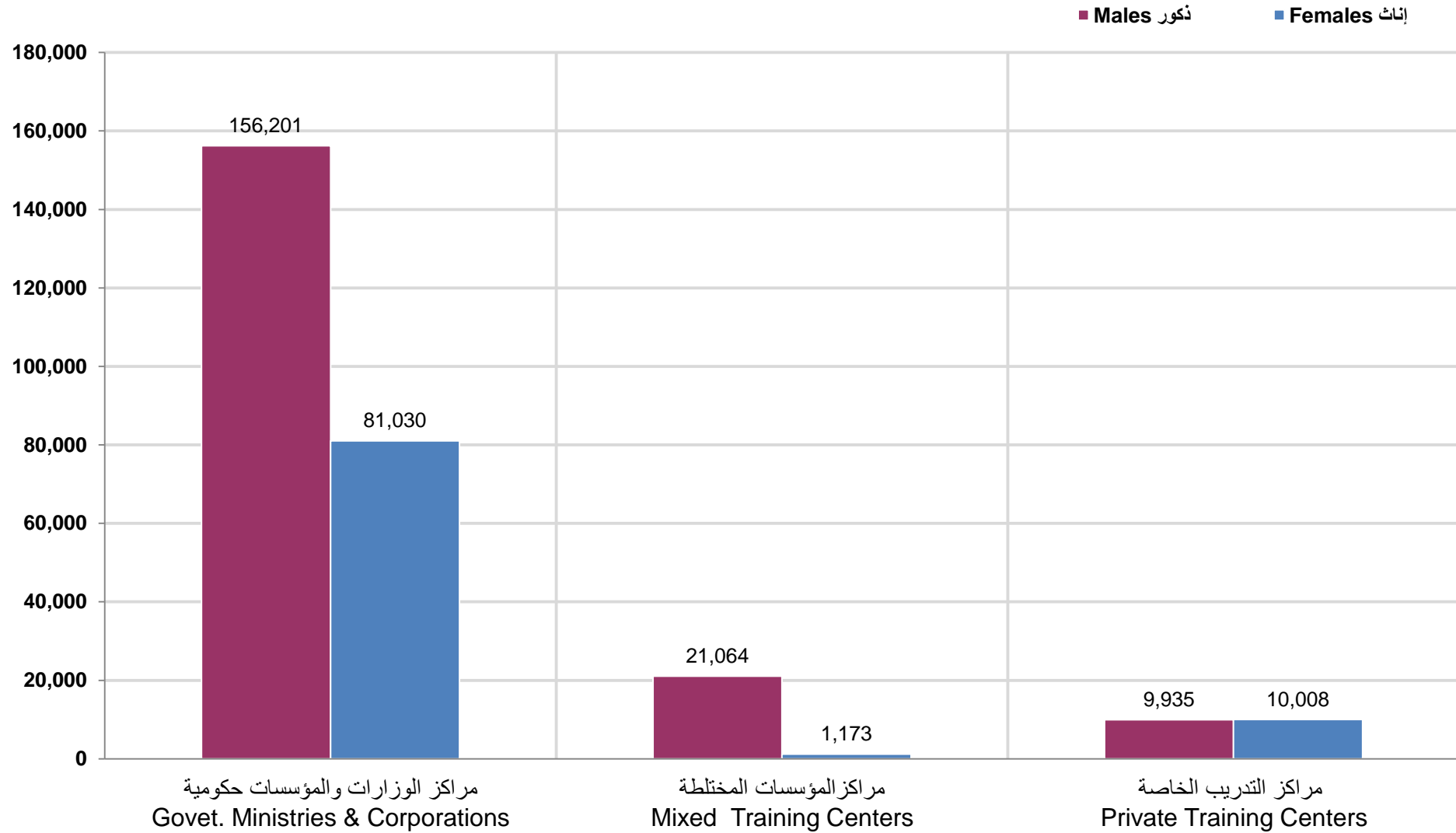
شكل رقم (34) Graph